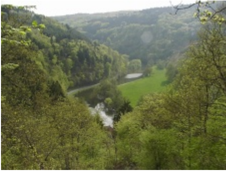
Aussicht vom "Almblick" ins Wiedtal