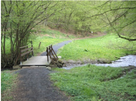
Brücke über den Laubach am Laubachswinkel